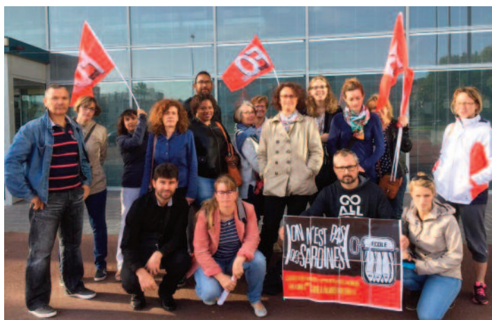
Parvis de l'inspection académique à Melun

Seul le SNUDI FO avait appelé les collègues à se mobiliser avec les parents d'élèves de leur école sur le parvis de l'IA.