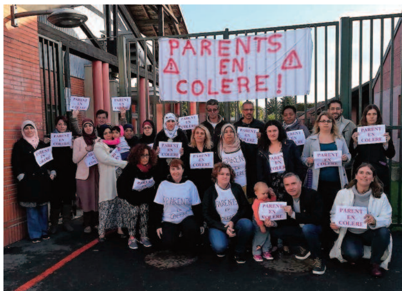
Ecole élémentaire Lavoisier - Lieusaint